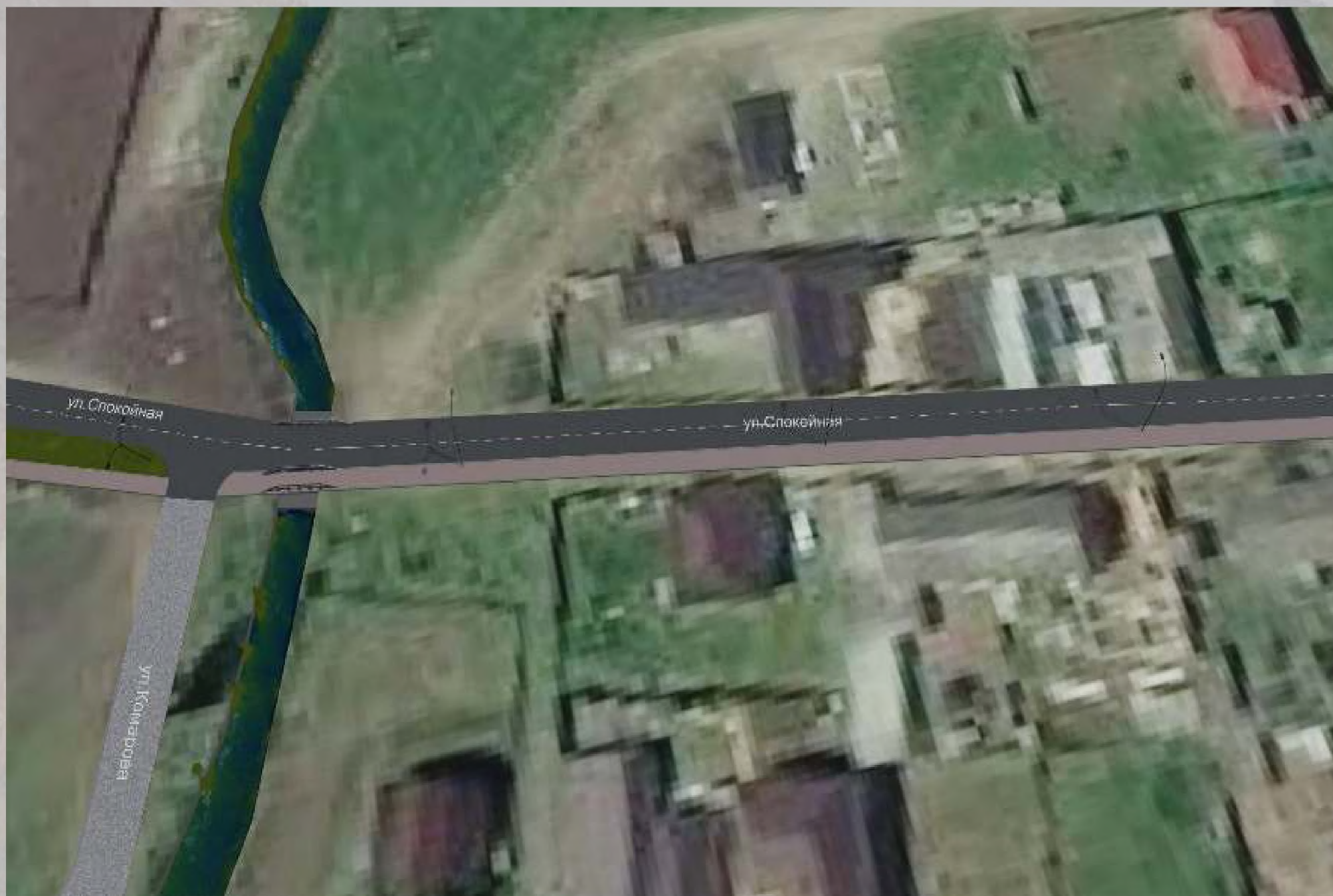
«Благоустройство общественной территории в г. Малгобек (ул.Спокойная - от ул. Нурадилова до ул. Гоголя)»