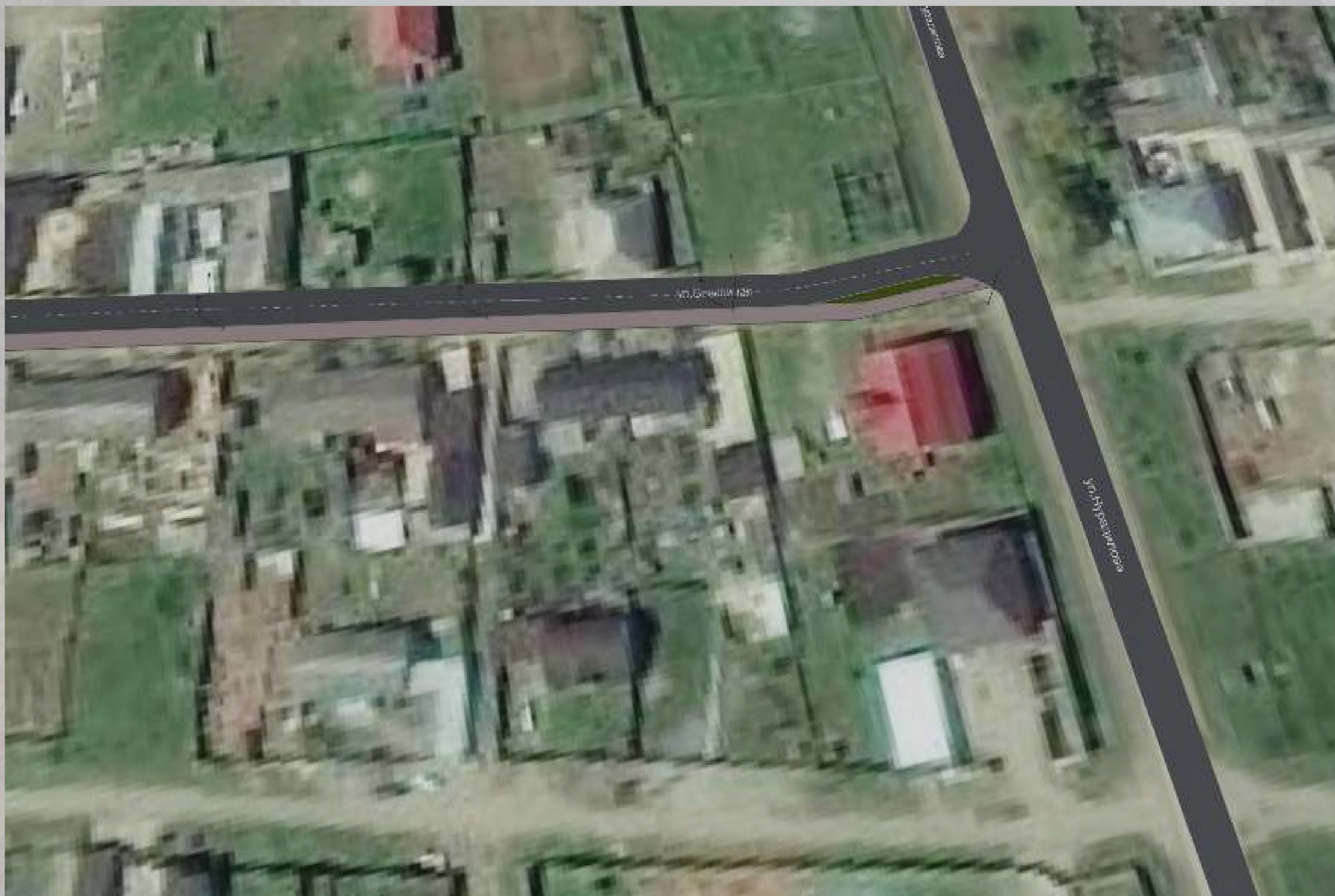
«Благоустройство общественной территории в г. Малгобек (ул. Спокойная - от ул. Нурадилова до ул. Гоголя)»